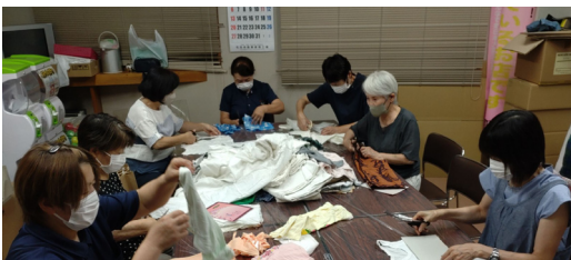
布切り作業の様子