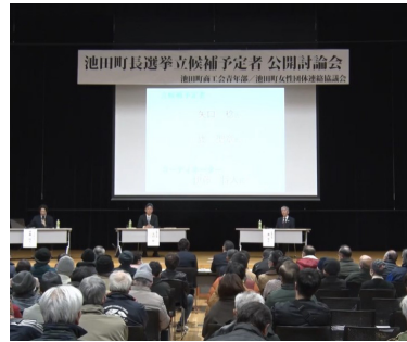
クロストークの様子

2月25日(日) 池田町交流センターかえでにおいて、池田町女性団体連絡協議会との共催で開催しました。池田町長選挙立候補を予定の2名に、町に対する思いを壇上で語っていただきました。当日は自身について語っていただく「フアーストスピーチ」、その後、立候補予定者同士で質問と回答を行っていただく「rostーク」の形式で、「少子化と人口減少問題」「財政問題」「防災対策」の3つのテーマについて熱く語っていただきました。後日あづみ野テレビ様のご協力のもとYouTubeにて見逃し配信を行い、多くの皆様に池田町への思いや人柄を知っていただく機会を創出できました。今後も池田町の将来にかかわる場面において、同様の討論会を実施してまいります。