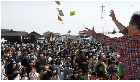
福まきの様子

本イベントは、各都会総出の商工会全体としてのイベントとして開催されました。ご協力いただいた皆様に感謝申し上げますとともに、引き続きのご協力をお願い申し上げます。