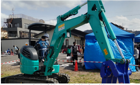
建設重機の乗車体験の様子