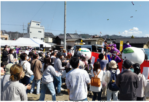
4年ぶりの福まきの様子

今回のイベントは、各協会のご協力のもと、初めて商工会全体事業として実施しました。ご協力いただいた皆様に改めて御礼申し上げます。