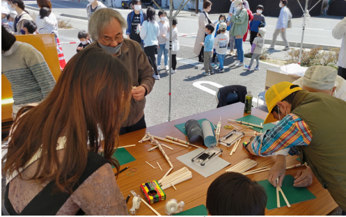
建設業部会によるものづくり体験教室